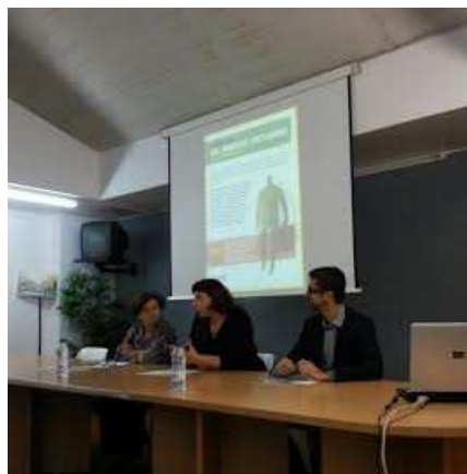
Inauguració del curs "Asil, Immigració i Drets Humans"